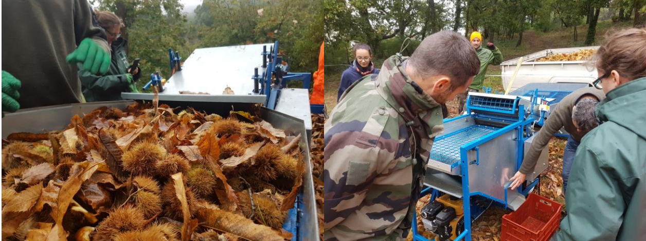
Entrée de la machine à éboguer

Les châtaignes sont ensuite passées dans une ébogueuse afin de séparer la bogue de la châtaigne. Cette opération est très rapide, environ 30 min – 1h pour 100 kg de châtaignes fraîches.